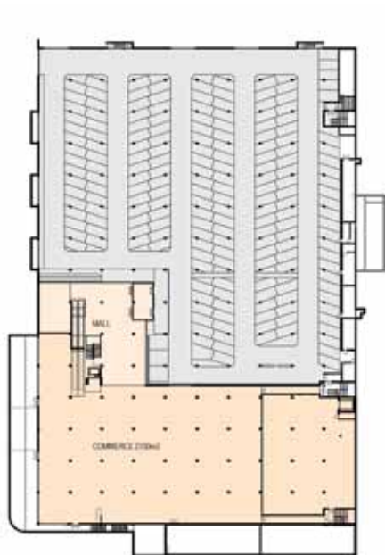
Plan du rez inférieur