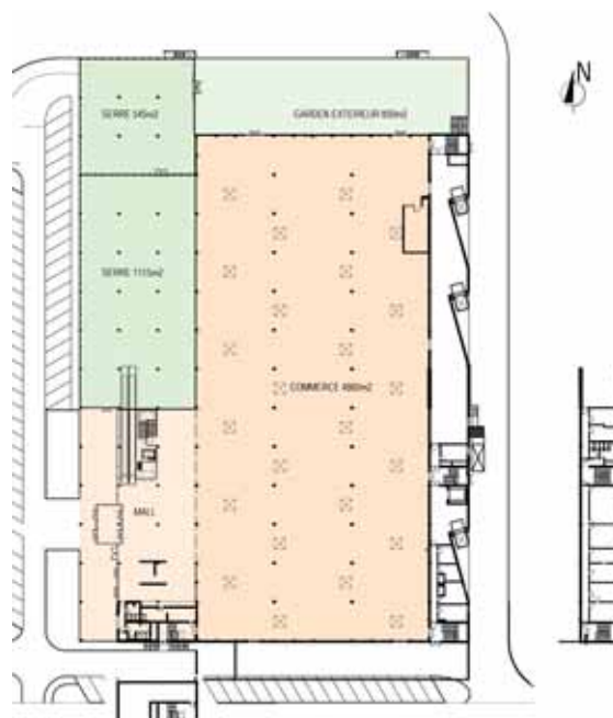
Plan du rez supérieur