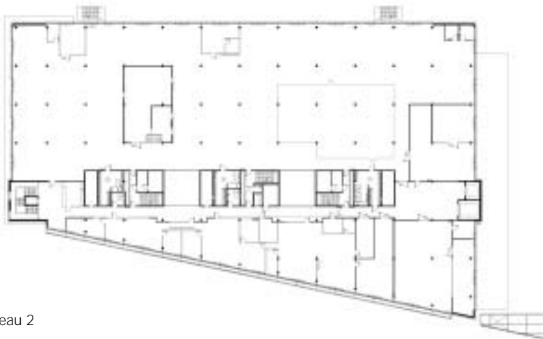
Plan niveau 2